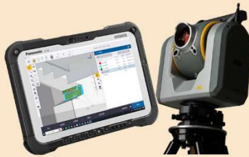
Trimble ACCESS & フィールドソリューション